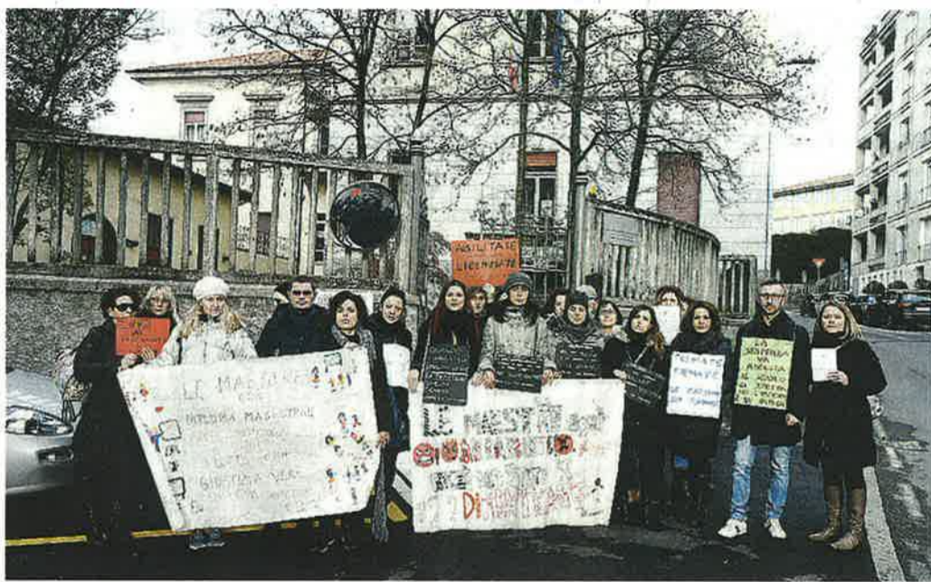
La protesta dello scorso gennaio fuori dalla sede dell'Ufficio scolastico provinciale