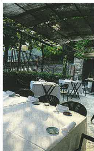
La terrazza per pranzi e cene